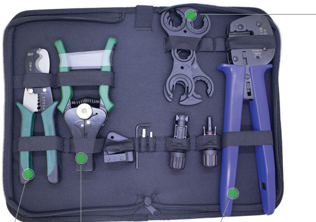
CORTADOR DE CABLES